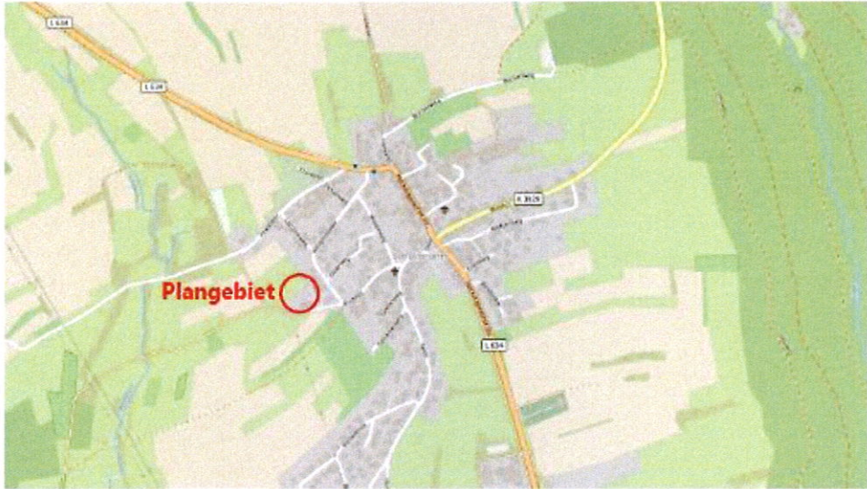
Gemeinde Waldbrunn, Ortsteil Schollbrunn