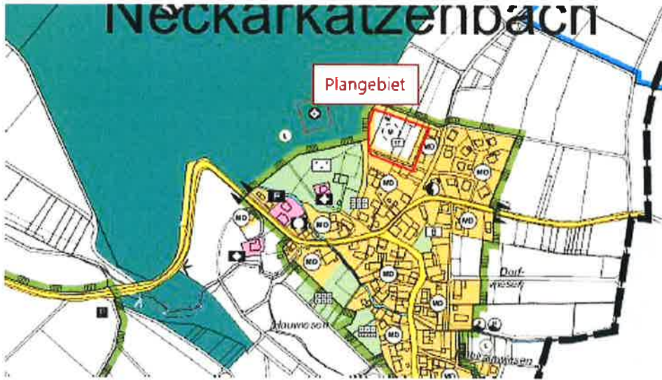
Gemeinde Neunkirchen, Ortsteil Neckarkatzenbach